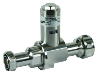
Оригинал может отличаться от изображения