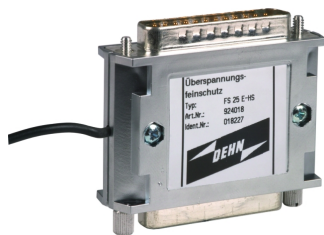
Оригинал может отличаться от изображения