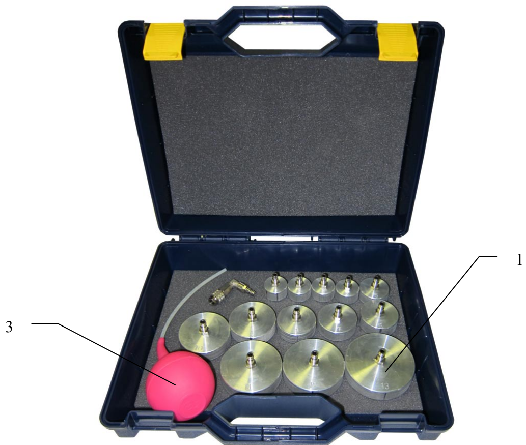
Рис.3 (набор адаптеров)