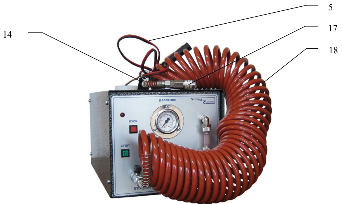
Рис.1 (вид спереди)