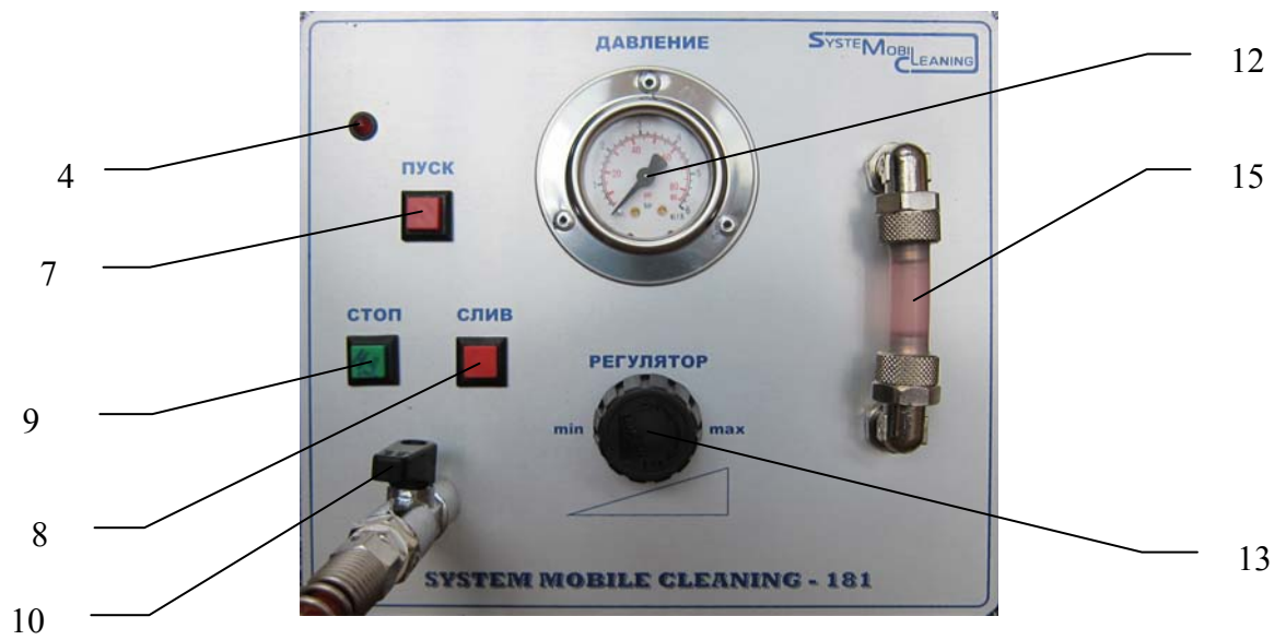
Рис.2 (передняя панель)